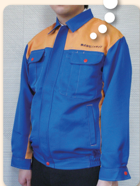
▲ 現地調査員の制服