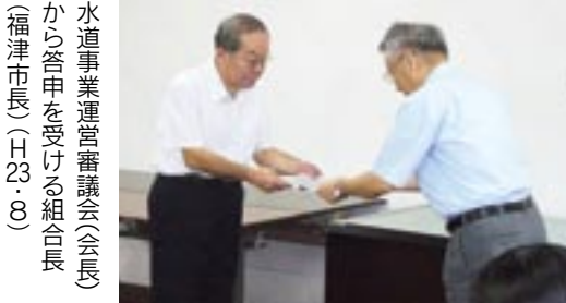
水道事業運営審議会(会長)から答申を受ける組合長(福岡市長)(H23・8)

いインフラ整備を行うこと。また、広域化に伴う配水ブロックの再編成など効率的な水運用を行い、水道料金についても見直し、市民の負担軽減に努めていただきたい。(水道ビジョン、審議会の会議録および答申書は、宗像地区事務組合のホームページに掲載しています。)