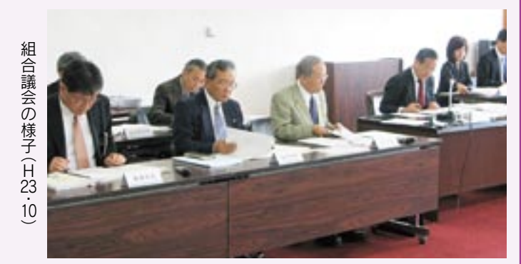
組合議会の様子(H23・10)

現在の水道料金は、水道事業統合前(宗像市・福津市)の料金体系を、そのまま採用する形となっており、給水区域内に複数の料金体系が混在した状況となっています。そのため、同一水道事業体の給水区域内にありながら料金格差が生じており、お客様の公平性が必ずしも担保されていない状況でした。 そこで、今回、宗像地区事務組合水道事業として、統一された料金体系を構築し、さらに事業統合のメリットを活かし、水道料金の改定を行うものです。 今後とも安心・安全な水を安定して提供できるように努めていきます。